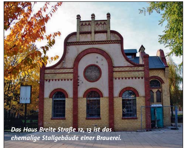
Das Haus Breite Straße 12, 13 ist das ehemalige Stallgebäude einer Brauerei.

im Jahr 1725 einen Zusammenschluss. Die erste Apotheke der Stadt öffnete im Jahr 1733 am Markt 4 (im Jahr 2015 die Pelikan-Apotheke). 1740 ließ die Stadt den Neuen Friedhof anlegen. 1745 wurde Luckenwalde zur Amtstadt. 1750 ließ Friedrich II. südwestlich der Jüterboger Vorstadt die Zinnaer Vorstadt anlegen. Auf seine Initiative hin siedelten sich zahlreiche Kolonisten aus Sachsen und Thüringen an, die zur Anwerbung zwei Groschen je Meile erhielten. In Luckenwalde angekommen stellte die Stadt ihnen ein Kolonistenhaus, ein Morgen Land sowie einen Morgen Wieswachs zur Verfügung. Außerdem waren sie für mehrere Jahre von der Steuer befreit. Am 26. Juni 1752 erhielten der Magistrat und die Bürgerschaft die Erlaubnis, eine Stadtziegelei zu errichten, um die anhaltende Bautätigkeit durch die Herstellung von Mauersteinen zu fördern. Drei Jahre später siedelten sich weitere 32 Kolonistenfamilien in der Heiðstraße an (ab dem Jahr 2015 die Rudolf-Breitscheid-Straße). Die Einwohnerzahl Luckenwaldes überschritt damit erstmals die Grenze von 2.000 Bürgern. 1772/1773 kam es zu einem in-