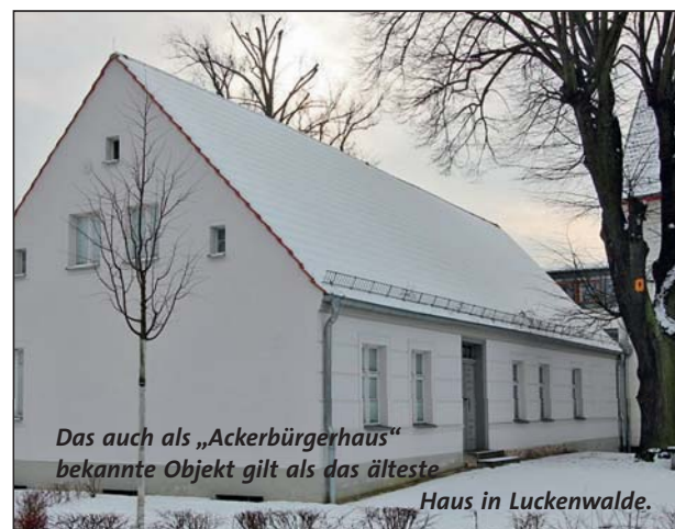
Das auch als „Ackerbürgerhaus“ bekannte Objekt gilt als das älteste Haus in Luckenwalde.

nerpreußischen Gebietstausch, wodurch Luckenwalde aus dem Herzogtum Magdeburg ausschied und dafür der Ziesarsche Kreis zu Magdeburg kam. Im Jahr 1776 lebten in Luckenwalde 2250 Einwohner in 346 Häusern. In der Stadt bestanden 20 Innungen, hinzu kamen 16 Weinberge, 150 Pferde, 200 Milchkühe und 100 Schafe.