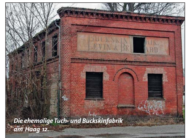
Die ehemalige Tuch- und Buckskinfabrik am Haag 12.