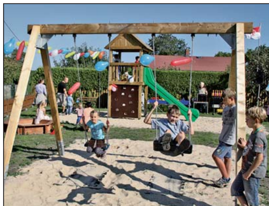
Der Spielplatz ist immer gut besucht – von kleinen GärtnerInnen und Kindern aus dem Wohnumfeld.

Der typische Gemeinschaftssinn war immer Bestandteil des Kleingartenlebens. In der Zeit nach 1990 war diese Solidarität besonders gefragt. Denn kaum war die staatliche Einheit da, schon geisterten die wildesten Gerüchte herum – auch in Potsdam. Und auch für das große Kleingartengebiet in Potsdam-West, wo immerhin neun Kleingartenanlagen ihr Zuhause haben. So begann das teilweise noch heute aktuelle Ringen der Potsdamer Kleingärtner um den Erhalt ihrer grünen Oasen. Auch die Gartenfreunde von „Unverzagt-Fliederweg“ waren und sind dabei, für dieses Ziel zu demonstrieren. Und sie können den Erfolg dieser Proteste verbuchen. Denn in Potsdam-West konnten die KGA erhalten bleiben. So können die KleingärtnerInnen von „Unverzagt-Fliederweg“ in diesem Jahr „Unverzagt unter blühendem Flieder“ ihr 90. Jubiläum feiern.