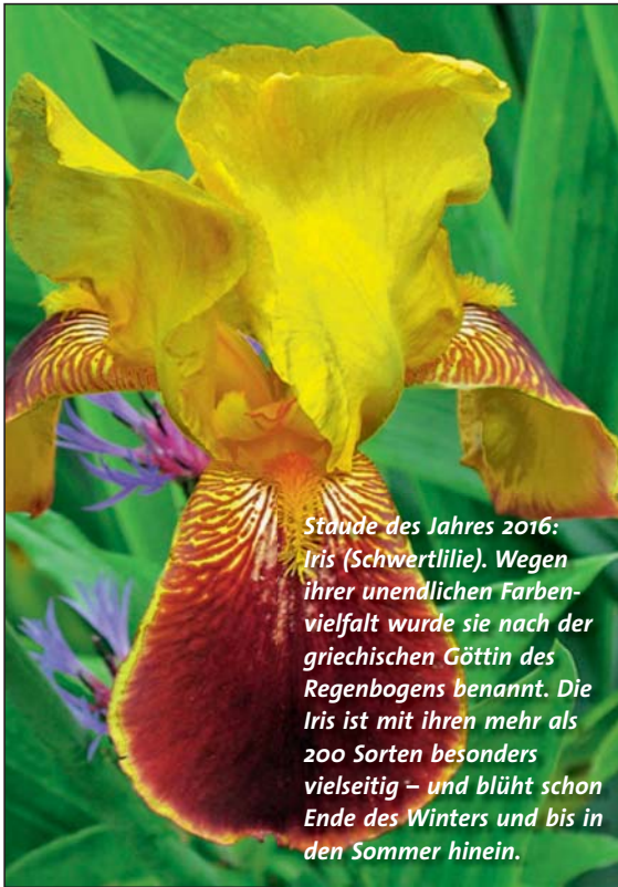
Stauden des Jahres 2016: Iris (Schwertlilie). Wegen ihrer unendlichen Farbenvielfalt wurde sie nach der griechischen Göttin des Regenbogens benannt. Die Iris ist mit ihren mehr als 200 Sorten besonders vielseitig – und blüht schon Ende des Winters und bis in den Sommer hinein.

VORMERKEN: 3. und 4. September 2016 – Berliner Staudenmarkt im Botanischen Garten Berlin-Dahlem