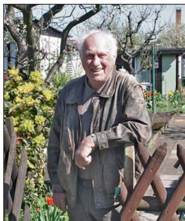
Unser Autor: Dr. Horst Mittelstädt

Größere Chancen bestehen bei offenem Boden für das Überleben der Blüten. Ein verunkrauteter oder mit organischem Material bedeckter Boden