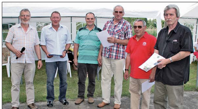
Die Auszeichnungsrunde mit der Ehrennadel des Kreisverbandes.

Die neu gegründete Kleingartenanlage erhielt, dem damaligen Zeitgeist entsprechend, den Namen „Deutsch-Sowjetische-Freundschaft“. Organisatorisch wurde sie dem Kreisverband Luckenwalde des VKSK angegliedert.