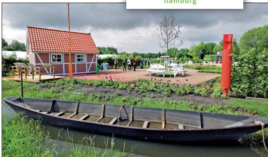
Marktplatz „Lebendige Kulturlandschaften“.