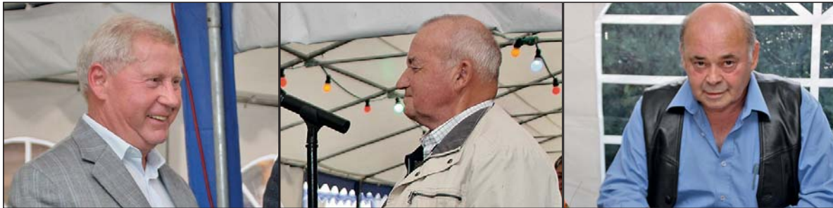
Die drei Höchstgeehrten und das Herthasee-Team.