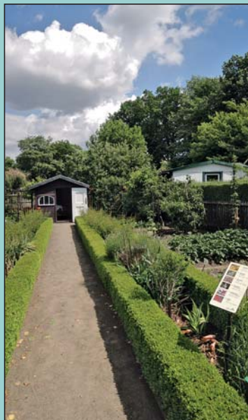
Foto: Leipzig, Museumsgarten